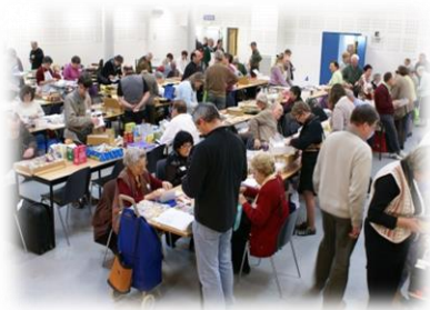
Assemblée Générale Réunion d'échanges du Club