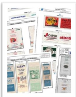
Catalogues : édition papier ou numérique